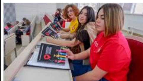
Семинар по добровольчеству в туризме Семинар для тим-лидеров из Ставрополя и городов КМВ по