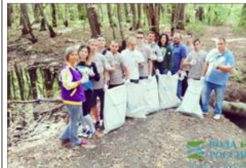
Волонтеры гостеприимства и экологические волонтеры - совместные акции Волонтеры гостеприимства и экологические волонтеры провели совместные акции, презентации в Георгиевске и городах КМВ - Кисловодск, Пятигорск, Железноводск