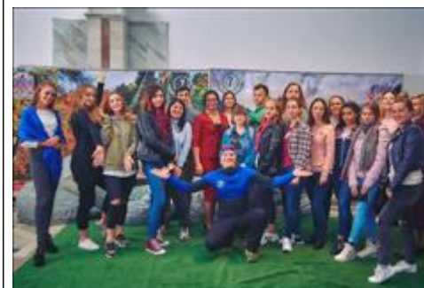
Осенний фестиваль волонтеров гостеприимства Осенний фестиваль волонтеров гостеприимства с участием региональных экспертов Северо-Кавказского географического общества, Школы Кавказского гостеприимства СКФУ, Центра языков и культур Пятигорского государственного университета.

Мероприятие: Презентационная кампания и организационные собрания волонтеров проекта