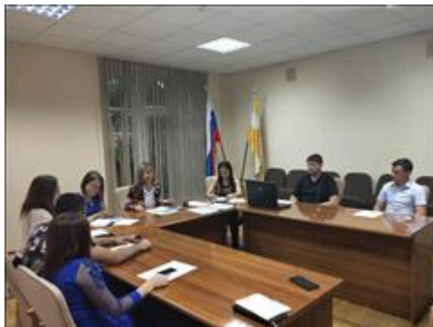
Рабочая встреча тим-лидеров в Железноводске Рабочая встреча тим-лидеров волонтерских корпусов городов-курортов КМВ состоялась в администрации города-курорта Железноводска 27 июля 2019 года.