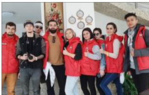
Экскурсионные программы в КЧР Команда волонтеров гостеприимства из Ставропольского края, КБР, Дагестана, Осетии и КЧР, организовала экскурсионные программы на горном курорте Архыз в КЧР