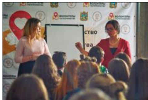
Осенний фестиваль Волонтеров гостеприимства Осенний фестиваль Волонтеров гостеприимства к Дню народного единства 7 ноября, г. Пятигорск