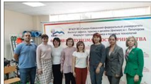
Рабочая встреча со Школой гостеприимства СКФУ

Презентация проекта для студентов Ставропольских вузов, октябрь 2019