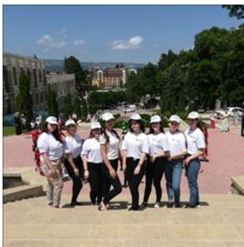
Волонтеры гостеприимства - курортный парк Кисловодск Еженедельные активности для туристов и отдыхающих организуют волонтерские корпуса гостеприимства Кисловодска.

Волонтеры гостеприимства городов КМВ проводят еженедельную программу активностей для туристов в парке Цветник в Пятигорске.