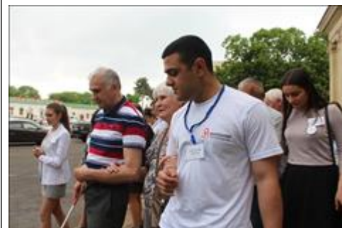
Социальный туризм - Эссентуки

Экскурсии для лиц с инвалидностью организуют волонтеры гостеприимства КМВ в Эссентуках.