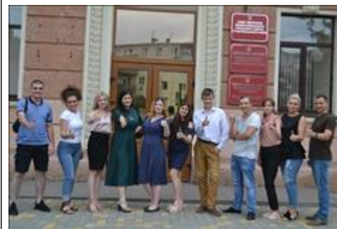
Презентация проекта, г. Минеральные Воды

Организовано сотрудничество Волонтеров гостеприимства с музеем "Россия - моя история" по вопросам изучения краеведения и культурно-исторического наследия Ставропольского края, обучения волонтеров музейному и экскурсионному делу.