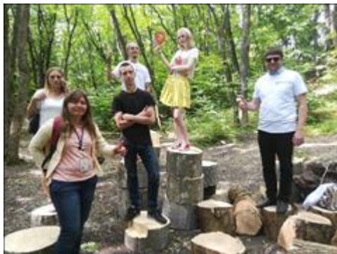
Экскурсионная волонтерская программа "Татарское городище"

В рамках сотрудничества с Краеведческим музеем, Волонтеры гостеприимства провели экскурсию и познавательную волонтерскую программу для семей с детьми "Татарское городище" (окрестности Ставрополя)