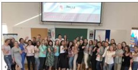
Презентация проекта для тим-лидеров

В августе 2019 года проведена презентация проекта Волонтеры гостеприимства в рамках вводного курса для тим-лидеров из 4 городов КМВ и города Ставрополя (50 человек)