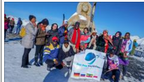
Международный форум добровольцев в Сочи Волонтеры гостеприимства провели экскурсии для иностранных участников Международного форум добровольцев по Олимпийскому Сочи