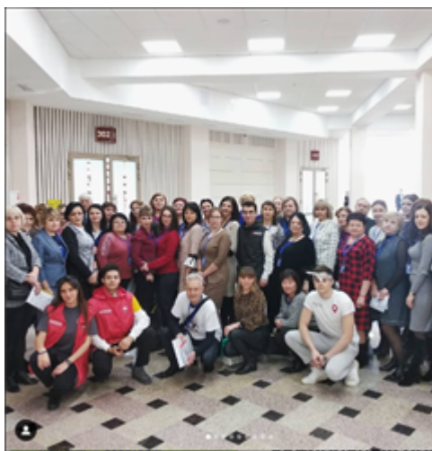
Серебряные Волонтеры гостеприимства

В августе 2019 г. проведена презентация проекта для Молодежного центра г. Минеральные Воды, вовлечены в проект более 200 волонтеров центра.