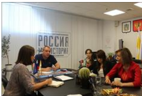
Рабочая встреча с партнером (Музей)

Организовано сотрудничество Волонтеров гостеприимства с музеем "Россия - моя история" по вопросам изучения краеведения и культурно-исторического наследия Ставропольского края, обучения волонтеров музейному и экскурсионному делу.