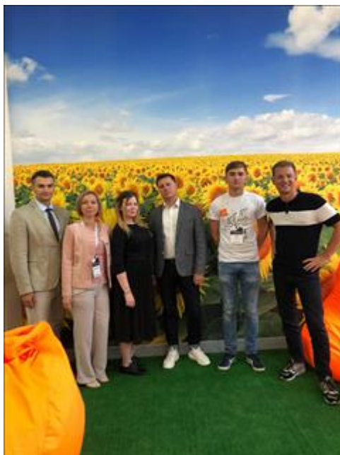
Волонтеры Том Соьер Фест Команда волонтеров, которые восстанавливают исторический облик городской среды (Том Соьер Фест - Ставрополье) включились в благоустройство мест туристского интереса