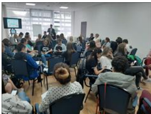
Тренинг команд сети Добровольческих центров гостеприимства