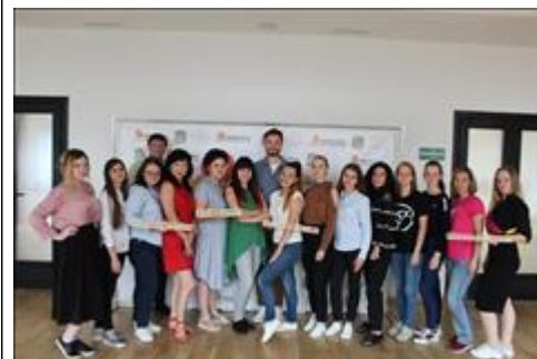
Тренинг команд сети добровольческих центров гостеприимства

Тренинг команд сети Добровольческих центров гостеприимства (г.Железноводск)