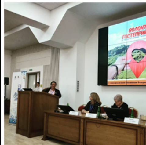
Презентация на Форуме серебряных волонтеров

В рамках сотрудничества с центрами Серебряного волонтерства при поддержке Минтруда и соцзащиты Ставропольского края, в проект "Волонтеры гостеприимства" включились Серебряные волонтеры Ставропольского края (более 2000 человек)