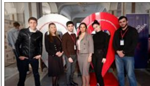
Добровольческий центр гостеприимства в Пятигорске Сотрудники и эксперты добровольческого центра гостеприимства в Пятигорске