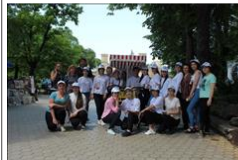
Центр гостеприимства Кисловодска Добровольческий Центр гостеприимства Кисловодска в курортном парке