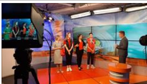
Презентационная кампания на ТВ Презентации проекта проводились на ТВ в форме прямых эфиров и интервью, охват составил более 500 тыс. зрителей (Ставропольский край).