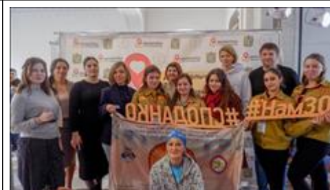
Стройотряды и Волонтеры гостеприимства Краевые стройотряды и Волонтеры гостеприимства на Зимнем фестивале волонтеров гостеприимства, презентация новых совместных проектов

Мероприятие: Презентация социальной франшизы "Добровольчество в сфере гостеприимства" на ежегодном Форуме Добровольцев