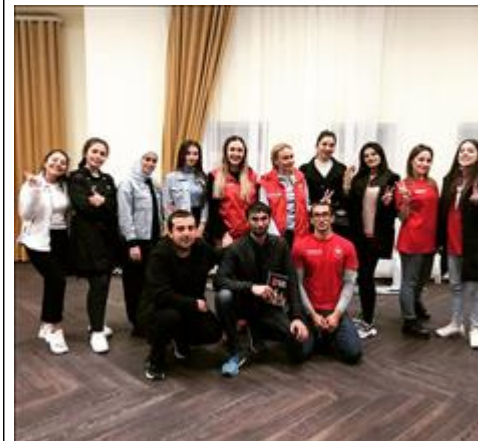
Волонтеры гостеприимства КЧР Волонтерский корпус гостеприимства - делегация КЧР

Зимний фестиваль Волонтеров гостеприимства Делегация Чеченской республики на Зимнем фестивале Волонтеров гостеприимства.