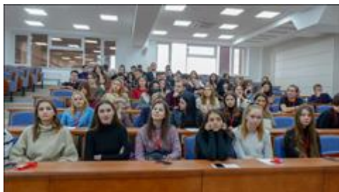
Семинары для волонтеров в СтГАУ 16 декабря на площадке Точки кипения СтГАУ в рамках Зимнего фестиваля Волонтеров гостеприимства прошли семинары для волонтеров с участием 5 экспертов, 20 тренеров Волонтеров гостеприимства, 400 студентов из 3 ведущих вузов Ставрополя (СКФУ, СГПИ, СтГАУ).