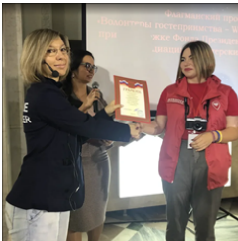
Зимний фестиваль Волонтеров гостеприимства Награждение Волонтеров гостеприимства благодарностями партнеров (Фонд "Посети Кавказ") на Зимнем фестивале в Пятигорске

всероссийских и международных организаций (Молодежная Ассамблея, Future Team, Всемирная Организация Скаутского Движения и др.)