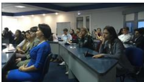
Презентация в ПГУ

Состоялась рабочая встреча с коллективом Школы Кавказского гостеприимства СКФУ, достигнуты договоренности о вовлечении студентов (более 3000 человек) и совместной разработке и реализации образовательной программы, проведении мероприятий.