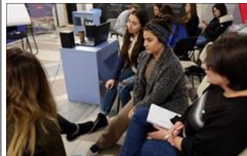
Семинар -практикум по медиа Практикум по медиа сопровождению проекта Волонтеры гостеприимства на международном уровне (эксперт - Д.Громатикополо, председатель Международной ассамблеи "Мы - Россияне")