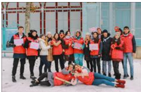
Добровольческий центр гостеприимства Железноводска Добровольческий центр гостеприимства Железноводска создан при поддержке Ставропольского пединститута и его