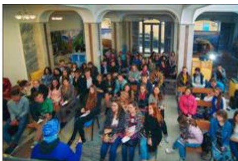
Презентация проекта для Волонтеров гостеприимства Презентация для будущих Волонтеров гостеприимства Добровольческий центр гостеприимства, г.Пятигорск, сентябрь 2019г.