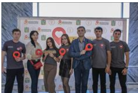
Команда Добровольческого центра гостеприимства Волонтеры Добровольческого центра гостеприимства в Пятигорске