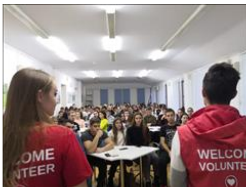
Презентация в Ставрополе

Проведена презентация проекта и вводная лекция для волонтеров города Ессентуки, сформированы возможные активности и проектные идеи для проекта Волонтеры гостеприимства