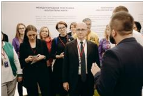
Международный форум добровольцев в Сочи На Международном форуме добровольцев в Сочи презентацию проекта в формате интерактивной площадки "Всемирная карта гостеприимства" посетили ВИП-эксперты форума (С.Кириенко, Т.Голикова, К.Разуваева).