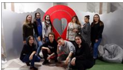
Блогеры Волонтеров гостеприимства Блогеры Волонтеров гостеприимства на семинаре по