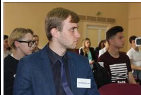
Волонтеры -участники презентации, Ессентуки

В августе 2019 года проведена презентация проекта Волонтеры гостеприимства в рамках вводного курса для тим-лидеров из 4 городов КМВ и города Ставрополя (50 человек)