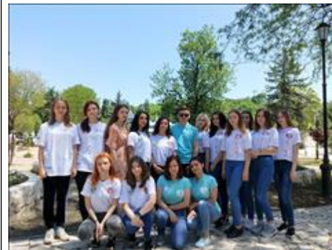
Волонтеры гостеприимства - программа активностей в Пятигорске

В рамках сотрудничества с Краеведческим музеем, Волонтеры гостеприимства провели экскурсию и познавательную волонтерскую программу для семей с детьми "Татарское городище" (окрестности Ставрополя)